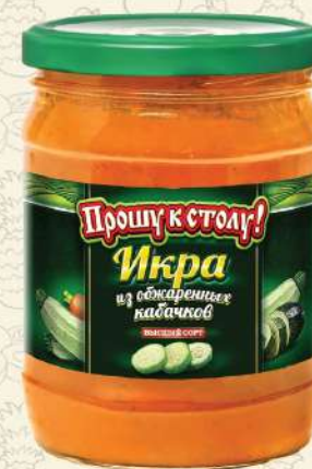
ИКРА из обжаренных кабачков