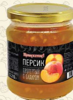
ПЕРСИК протертый с сахаром