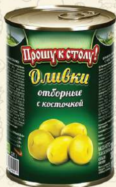
ОЛИВКИ отборные с косточкой