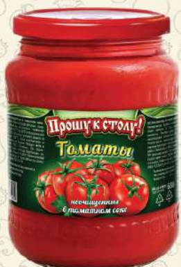
ТОМАТЫ неочищенные в томатном соке