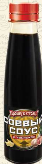
СОЕВЫЙ СОУС с чесноком