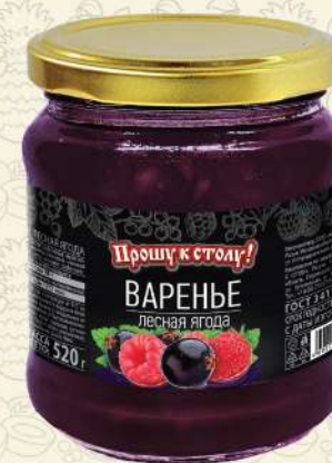
ВАРЕНЬЕ лесная ягода