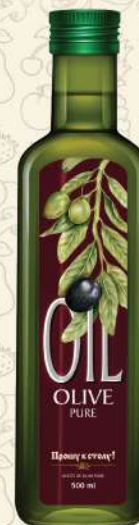
МАСЛО ОЛИВКОВОЕ Pure темная