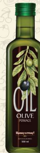
МАСЛО ОЛИВКОВОЕ Pomace темная