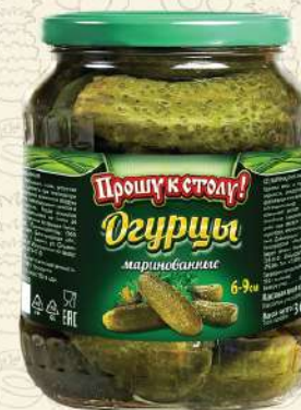
ОГУРЦЫ маринованные 6-9 см