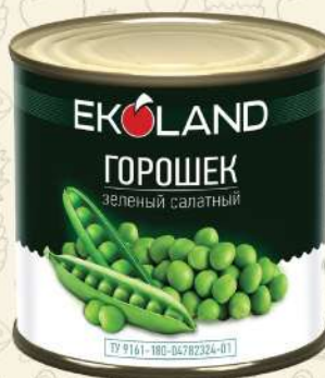
ГОРОШЕК зелёный / ТУ