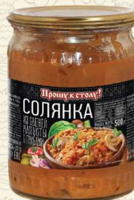
СОЛЯНКА из свежей капусты с грибами