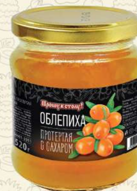
ОБЛЕПИХА протертая с сахаром