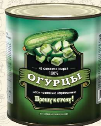
ОГУРЦЫ маринованные нарезанные