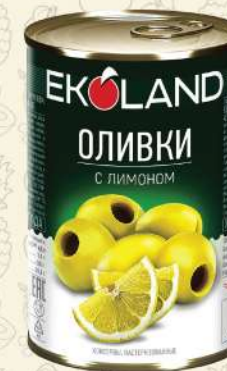
ОЛИВКИ с лимоном