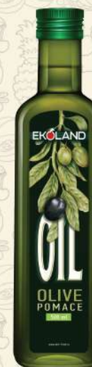
МАСЛО ОЛИВКОВОЕ Pomace темная