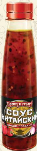
СОУС КИТАЙСКИЙ кисло-сладкий