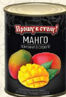
МАНГО ломтики с виропе