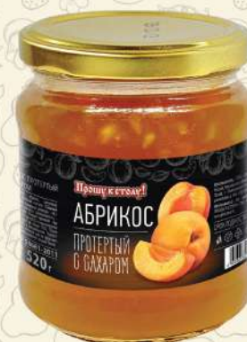
АБРИКОС протертый с сахаром