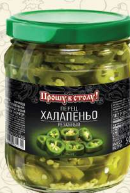
ПЕРЕЦ халапеньо резанный