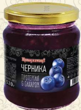
ЧЕРНИКА протертая с сахаром