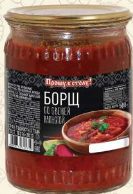
БОРЩ со свежей капустой