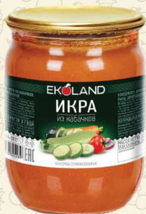
ИКРА из кабачков обжаренных