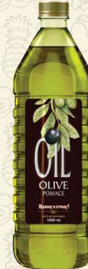
МАСЛО ОЛИВКОВОЕ Pomace темная