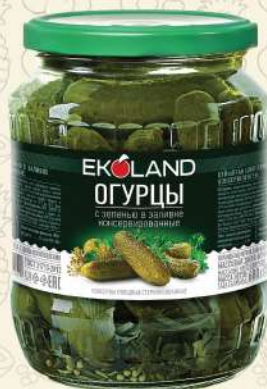
ОГУРЦЫ консервированные с зеленью в заливке