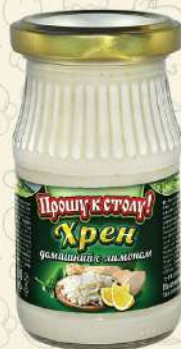
ХРЕН домашний с лимоном