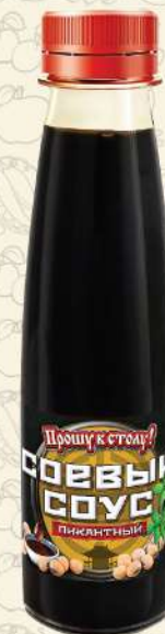
СОЕВЫЙ СОУС пикантный