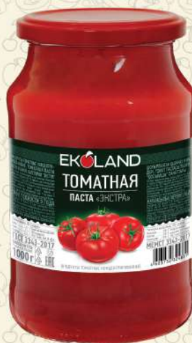
ТОМАТНАЯ «ЭКСТРА» паста