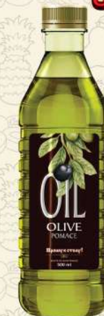
МАСЛО ОЛИВКОВОЕ Pomace темная