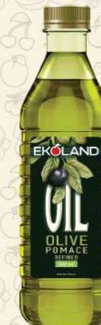
МАСЛО ОЛИВКОВОЕ Pomace темная