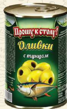
ОЛИВКИ с тунцом