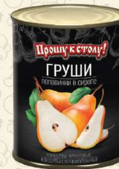
ГРУШИ половинки с виропе