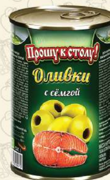
ОЛИВКИ с сёмгой