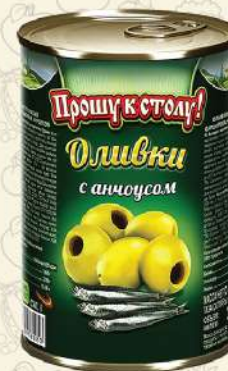
ОЛИВКИ с анчоусом