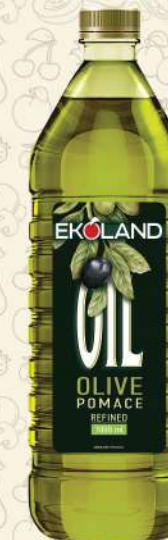
МАСЛО ОЛИВКОВОЕ Pomace темная