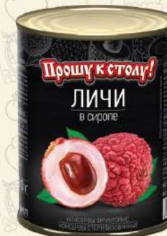
ЛИЧИ в виропе