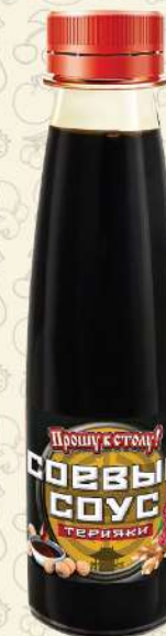
СОЕВЫЙ СОУС терияки