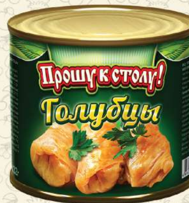
ГОЛУБЦЫ с мясом