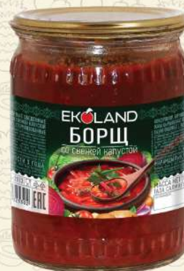
БОРЩ со свежей капустой