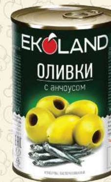
ОЛИВКИ с анчоусом