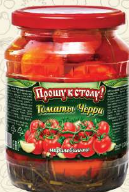
ТОМАТЫ ЧЕРРИ маринованные