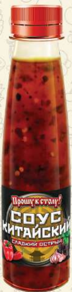
СОУС КИТАЙСКИЙ сладкий острый