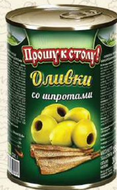
ОЛИВКИ со шпротами