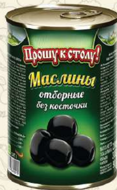
МАСЛИНЫ отборные без косточки