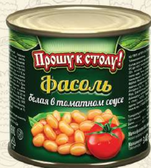
ФАСОЛЬ белая в томате