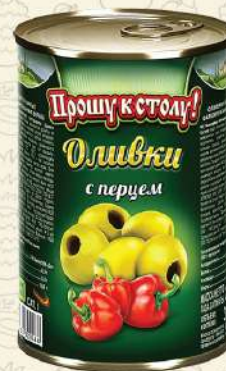
ОЛИВКИ с перцем