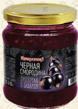
ЧЕРНАЯ СМОРОДИНА протертая с сахаром