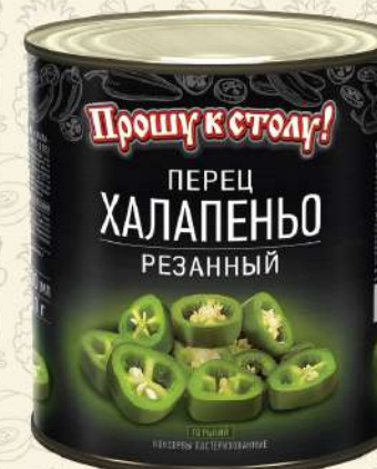
ПЕРЕЦ ХАЛАПЕНЬО резанный