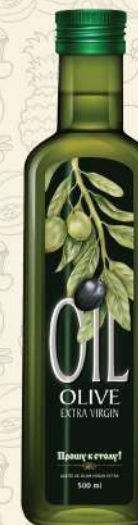
МАСЛО ОЛИВКОВОЕ Extra virgin темная