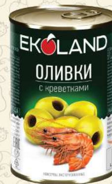
ОЛИВКИ с креветками