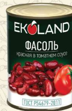
ФАСОЛЬ красная в томате