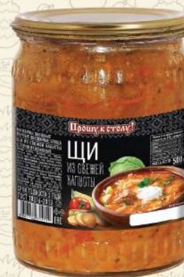
ЩИ из свежей капусты