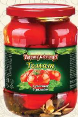
ТОМАТЫ с зеленью в заливке