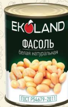
ФАСОЛЬ белая в томате