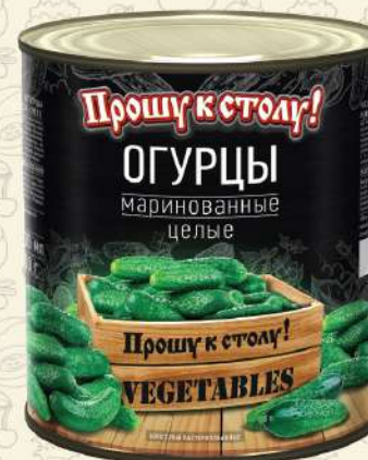
ОГУРЦЫ маринованные целые