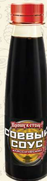
СОЕВЫЙ СОУС классический