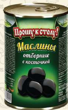
МАСЛИНЫ отборные с косточкой