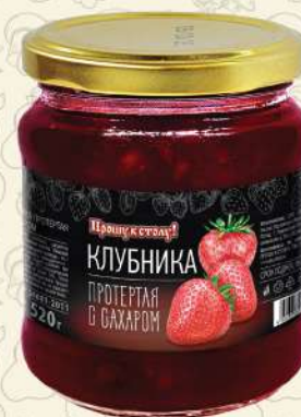
КЛУБНИКА протертая с сахаром