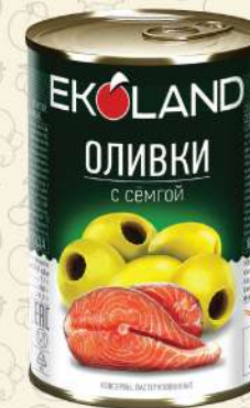
ОЛИВКИ с сёмгой