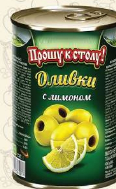
ОЛИВКИ с лимоном