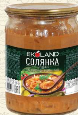
СОЛЯНКА овощная из свежей капусты