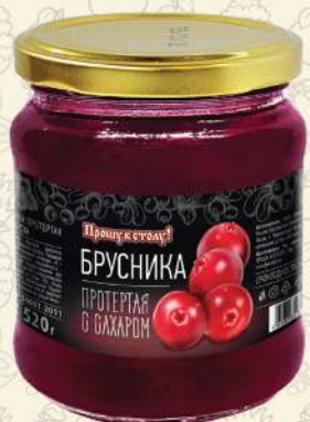
БРУСНИКА протертая с сахаром