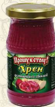
ХРЕН домашний со свеклой