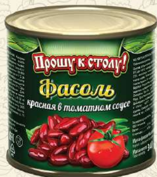
ФАСОЛЬ красная в томате