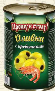
ОЛИВКИ с креветками