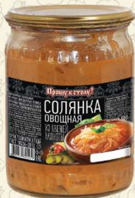
СОЛЯНКА овощная из свежей капусты