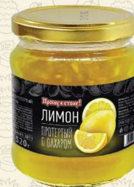
ЛИМОН протертый с сахаром