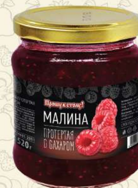
МАЛИНА протертая с сахаром