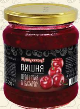
ВИШНЯ протертая с сахаром