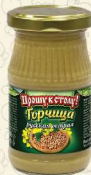
ГОРЧИЦА русская острая