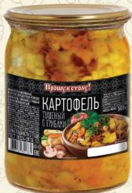
КАРТОФЕЛЬ тушеный с грибами