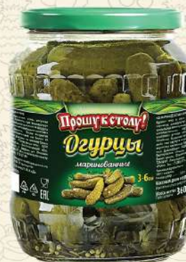
ОГУРЦЫ маринованные 3-6 см