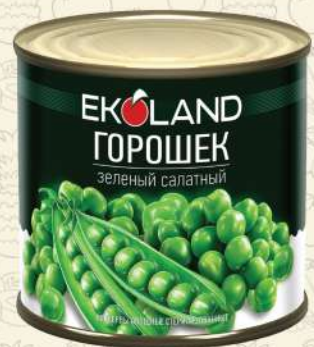
ГОРОШЕК зелёный / ГОСТ