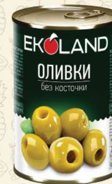
ОЛИВКИ без косточки