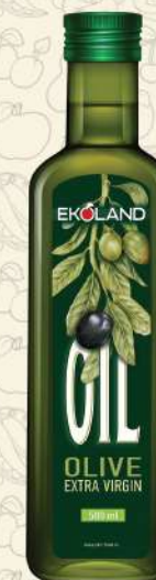
МАСЛО ОЛИВКОВОЕ Extra virgin темная