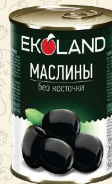
МАСЛИНЫ без косточки