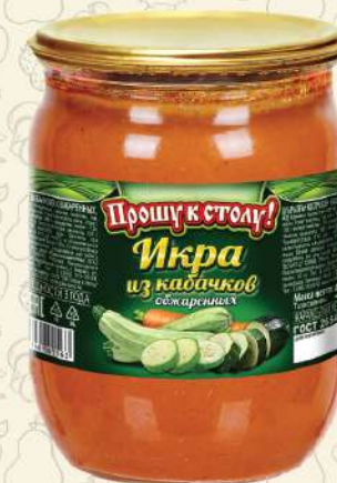
ИКРА из кабачков обжаренных