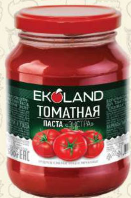
ТОМАТНАЯ «ЭКСТРА» паста