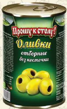
ОЛИВКИ отборные без косточки