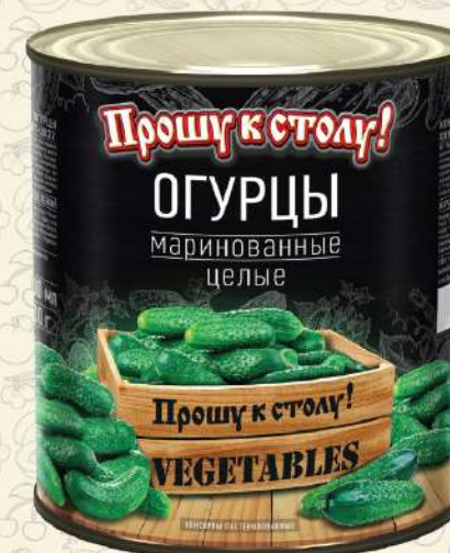
ОГУРЦЫ маринованные целые