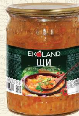
ЩИ из свежей капусты