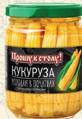
КУКУРУЗА молодая в початках